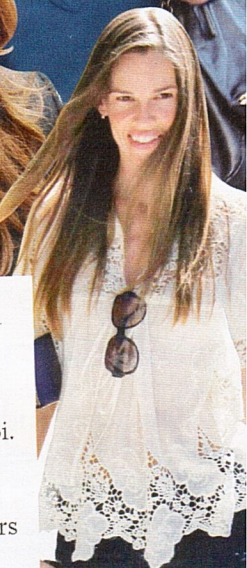
... et Hilary Swank élèvent des poules.